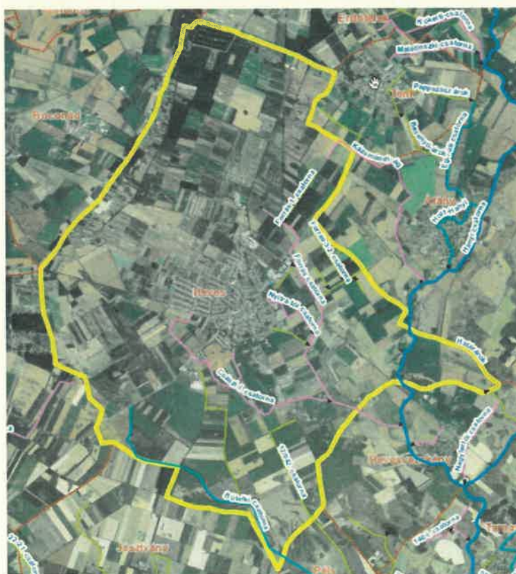
Heves város lehatárolása, főbb csatornák