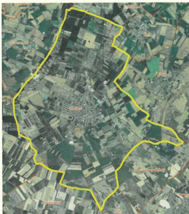
Heves közigazgatási területe

A Hanyi-Sajfoki belvízrendszer a Tisza jobbpartján, a Bábere és a Milléri belvízöblözet között terül el, 553,0 km 2 a területe. Domborzata uralkodóan sík, csak az É-i rész Heves vonalától É-ra mutat némi átmenetet a hajlásos, dombvidéki jellegre. A felszín É-i irányból lejt D-DK-re. Átlagos felszínesítés 0,50 m/km. Pély-Kisköre térségében már csak 0,1-0,2 m/km.